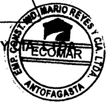
CONSTRUCTORA MARIO REYES Y CÍA. LTDA. Rut N° 81.714.500-0