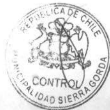
JOSÉ GUERRERO VENEGAS ALCALDE MUNICIPALIDAD DE SIERRA GORDA